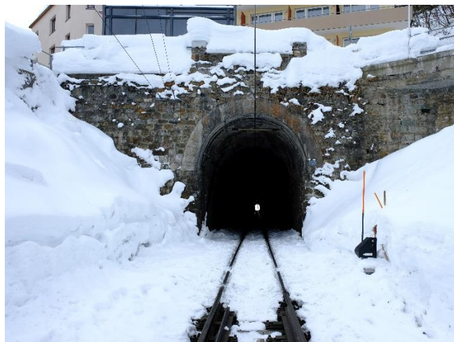
Abbildung 5: Portal Seite Arosa