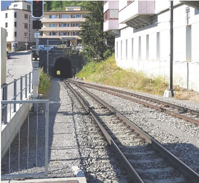
Abbildung 6: Voreinschnitt Arosa