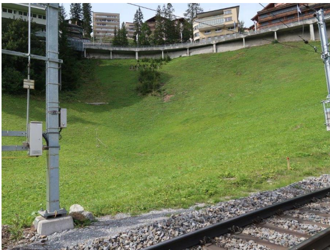
Abbildung 14: Portal Seite Chur, Bereich der späteren Geländemodellierung