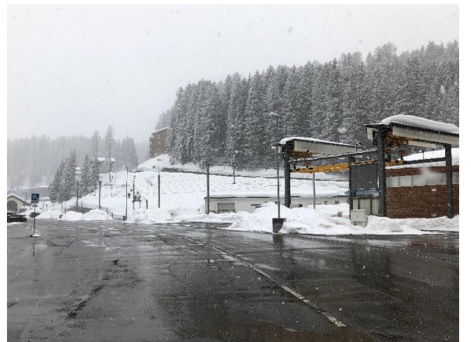
Abbildung 11: Installationsfläche Bahnhof Arosa