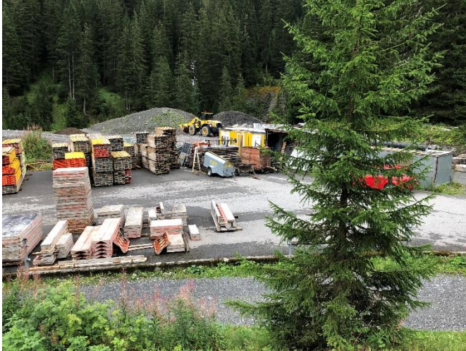
Abbildung 17: Installationsfläche In da Brünscht