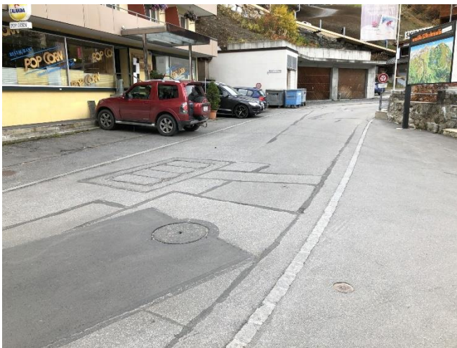
Abbildung 8: Seeblickstrasse (direkt über Portal Arosa)