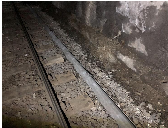
Abbildung 2: Arosertunnel, bestehende Sohle mit Zoreskanal rdB