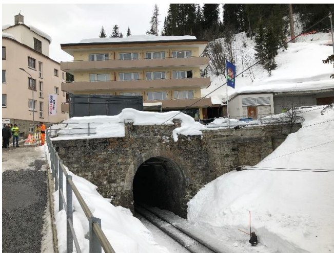
Abbildung 4 Portal Seite Arosa, im Hintergrund Hotel «Haus am Wald»