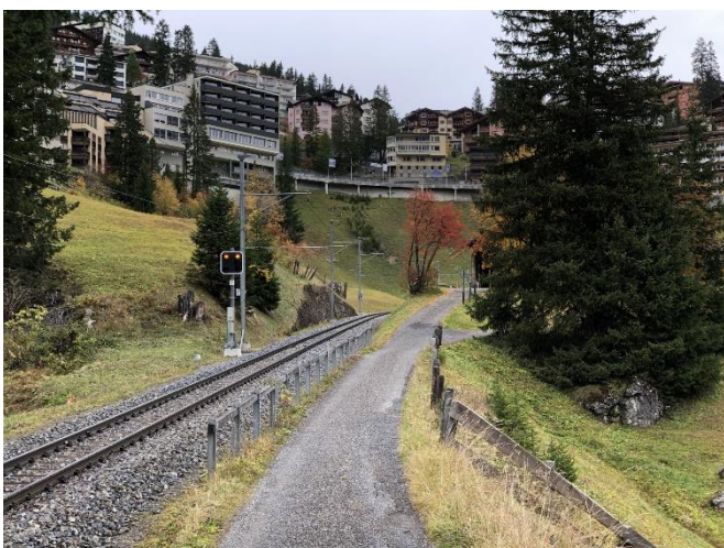
Abbildung 16: Übergang Seegruebeweg zu Baupiste auf Trasse