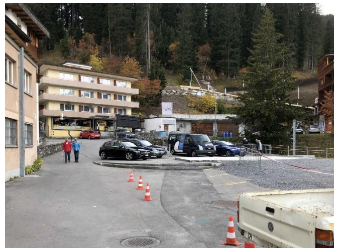
Abbildung 9: Bereich Zufahrt zur Hilfsbrücke