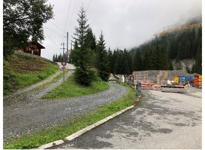
Abbildung 18: Zufahrt ab Bahntrasse zur Installationsfläche In da Brünscht