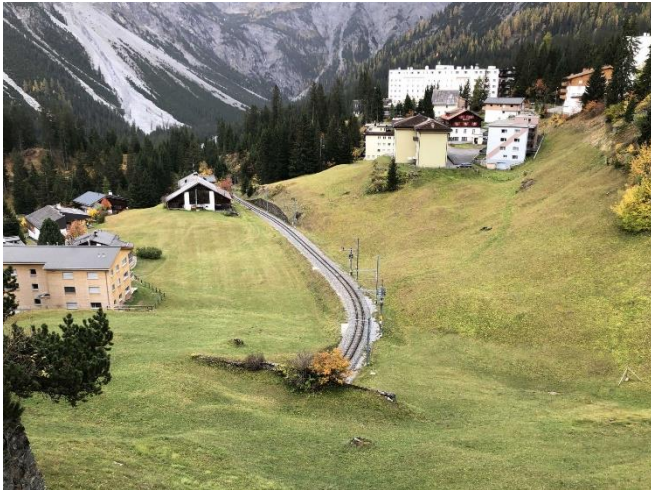
Abbildung 12: Portalbereich Seite Chur