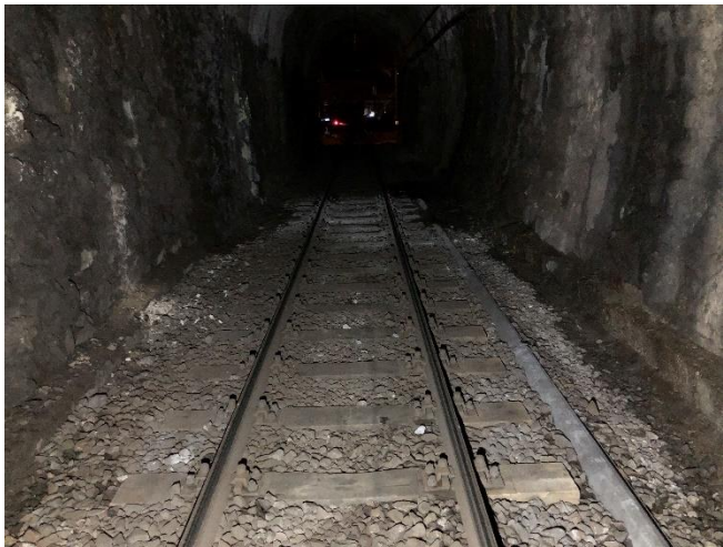
Abbildung 1: Arosertunnel, bestehende Sohle