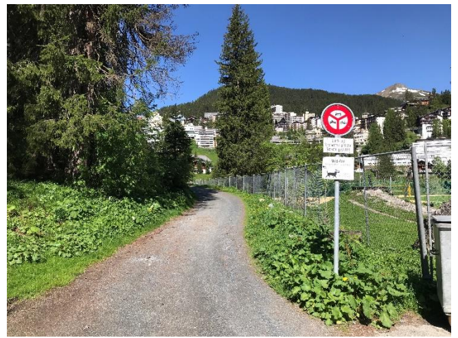
Abbildung 15: Zufahrt Seewald-/Seegruebeweg (Start bei Seegrubeplatz)