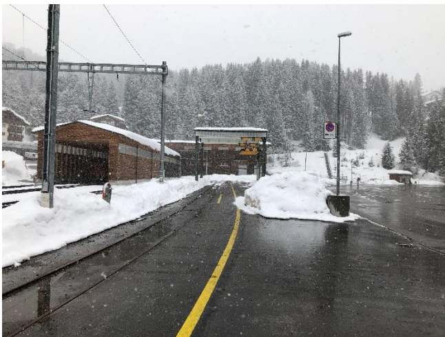
Abbildung 10: Bahnhof Arosa Gleis 59 und Installationsfläche