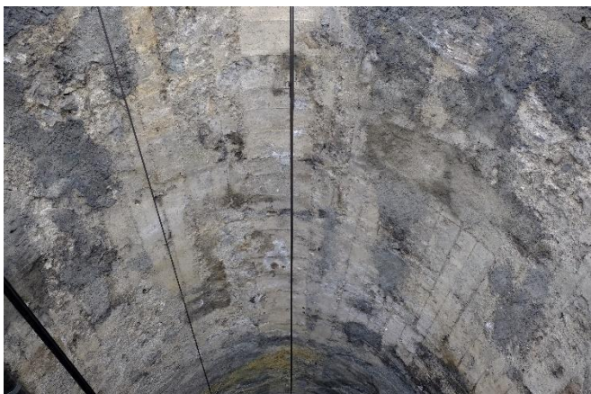
Abbildung 3: Arosertunnel, bestehendes Gewölbe