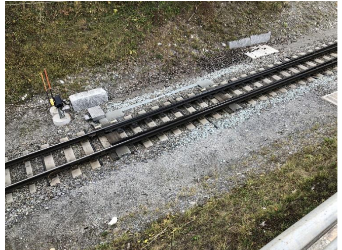
Abbildung 7: Voreinschnitt Arosa, Weichenantrieb und Schächte